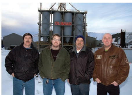
LES SABLES OLIMAG inc.